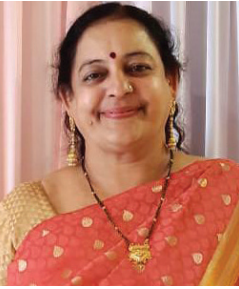
સદગુરુ કૃપા હી કેવલમ

અનાહત અથવા હૃદય ચક્રએ ચોથું પ્રાથમિક ચક્ર છે. જે શક્તિ બૌદ્ધ કે હિન્દુ તાંત્રિક પરંપરાઓ સાથે સંકળાયેલું છે. અનાહતનો અર્થ અનહર્ટ, અનસ્ટ્રક કે અજેટ નાદ એટલે કે અવકાશી ક્ષેત્રના અવાજ સાથે સંકળાયેલ છે. અનાહત સંતુલન, શાંતિ અને નિર્મળતા સાથે સંકળાયેલ છે. આ ઉપરાંત અનાહતનો એક અર્થ બે ભાગોનો સ્પર્શ કર્યા વિના ઉત્પન્ન થતો અવાજ! અહીં સુધી જીવ પોતાની એકની શક્તિ સાથે ઝડપ મતો હતો, અને જાગવા મથતો હતો. જ્યારે હૃદય ચક્રમાં અન્યની લાગણી લુ લાગણીનો પ્રહાર થતાં એને એ શક્તિ સામે પણ સ્પર્શ કર્યા વગર